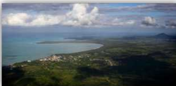
El municipio de Miches, de fondo Punto Hicaco, Punta Esmeralda, Laguna Redonda y la Montaña Redonda.

Esta riqueza natural no ha pasado desapercibida por inversionistas locales y extranjeros, quienes vislumbran a Miches como el próximo gran destino turístico del Caribe.