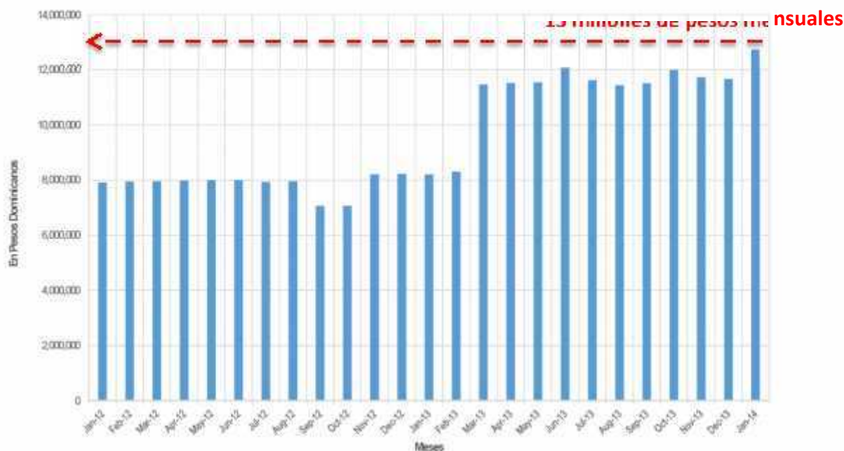
Gráfico 2. Total Descuentos ADP a la carga fija salarial docente del MINERD Enero 2012-Enero 2014