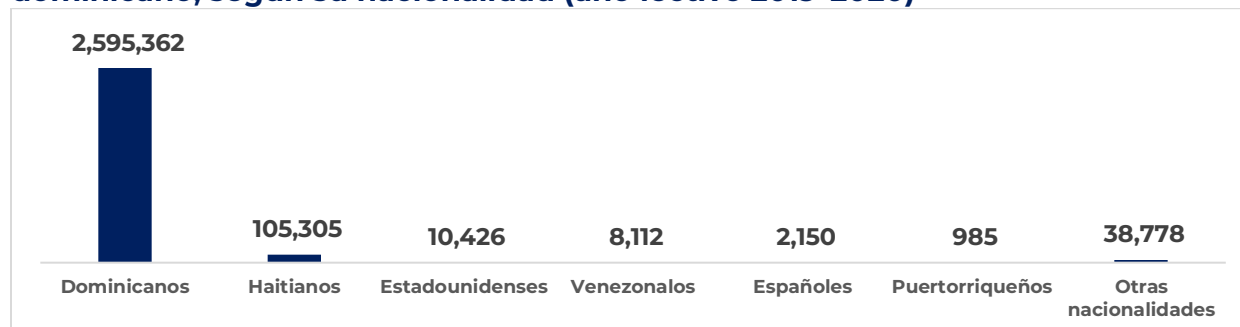
Gráfico 1. Distribución de estudiantes en el sistema educativo preuniversitario dominicano, según su nacionalidad (año lectivo 2019-2020)

Fuente: Elaboración propia a partir del Anuario de Estadísticas Educativas. Año 2019-2020 (MINERD, 2021).